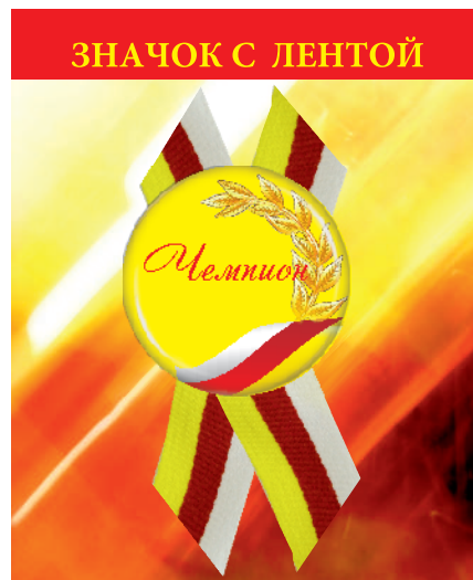
▲ значок закатной d - 50 мм с лентой