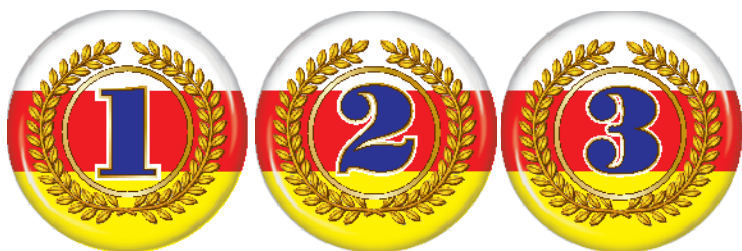
▲ значок закатной d - 50 мм