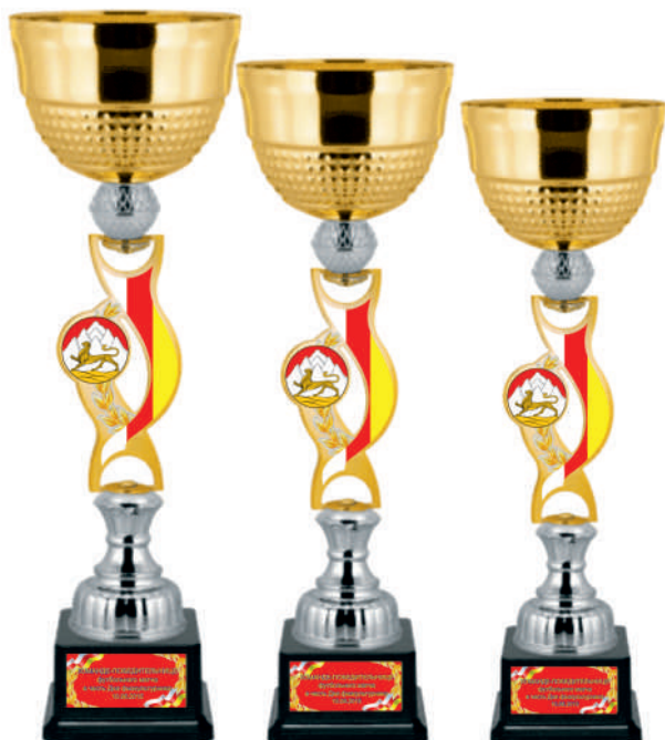
◀ KM 1608a 53 см KM 1608b 50 см KM 1608c 47 см