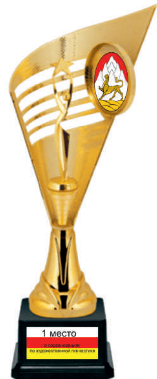
1 место в соревнованиях по художественной гимнастике