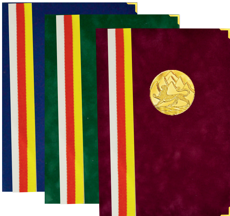
▶ папки из флока с накладкой и лентой