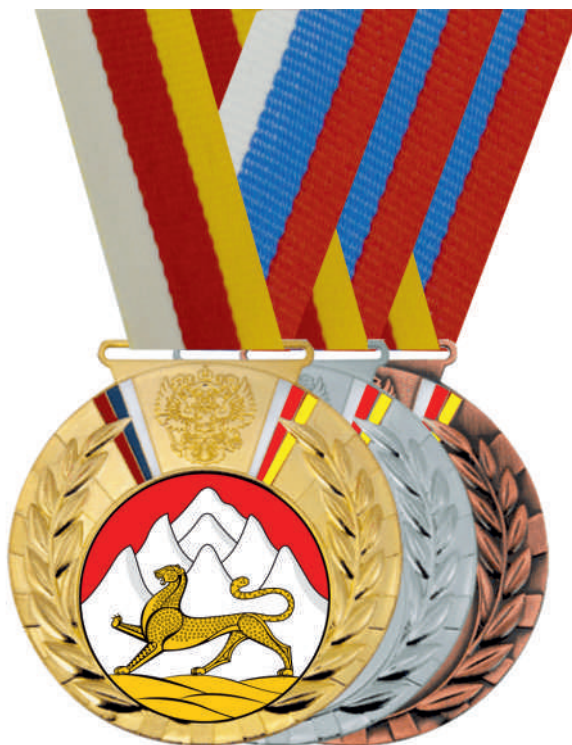
▲ МК227 d - 80 мм