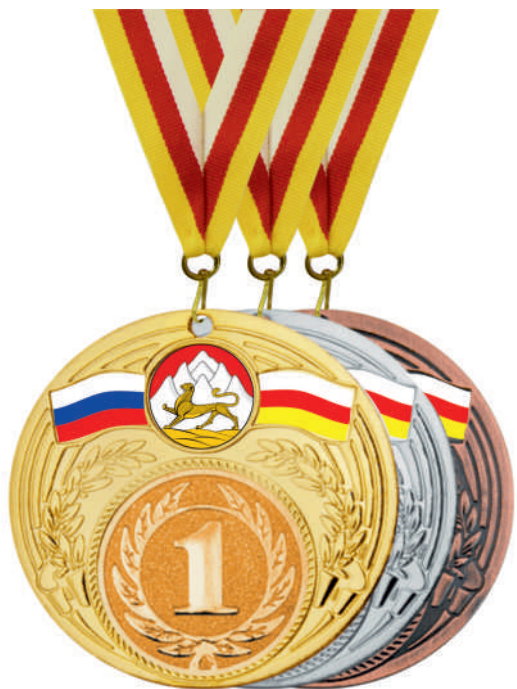
▲ МК203 d - 70 мм