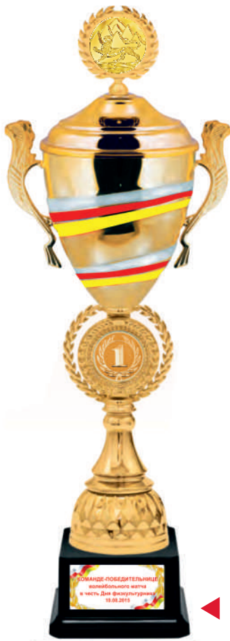
KM 1557a 53,5 см KM 1557b 50 см KM 1557c 45 см