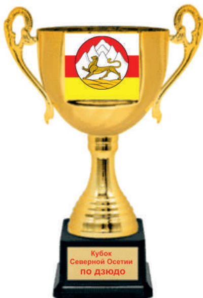
KM 1672 42,5 см KM 1672 38,5 см KM 1672 35 см