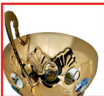
▶ KM 1409a 40,5 см KM 1409b 37,5 см KM 1409c 34 см