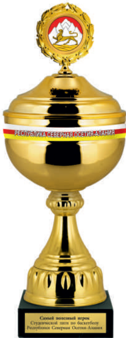
▲ KM 840a 40,5 см KM 840b 37 см KM 840c 33 см KM 840d 31 см