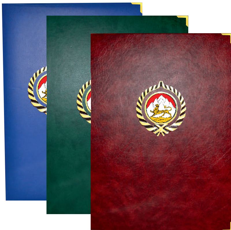
▶ папки из бумвинила с накладкой