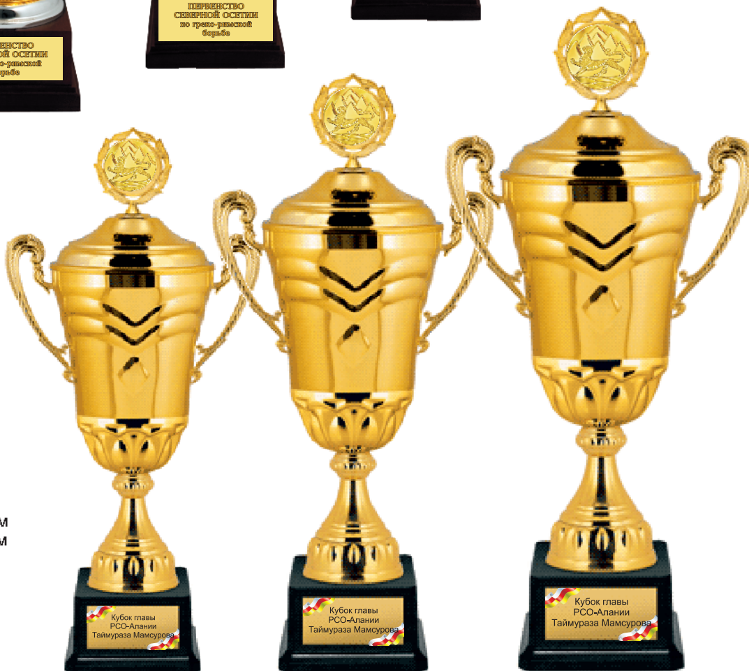
▶ KM 1496a 62 см KM 1496b 57,5 см KM 1496c 53,5 см

Кубок главы РСО-Алания Таймураза Мамсурова