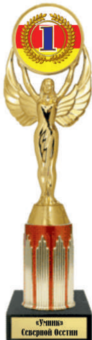
▲ Ps1005a - 27,5 см Ps1005b - 25 см Ps1005c - 12,5 см