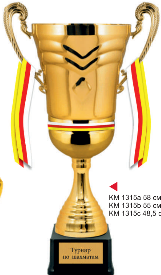
▲ KM 1315a 58 см KM 1315b 55 см KM 1315c 48,5 см