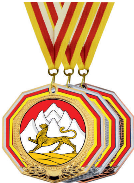
▲ МК194 d - 70 мм