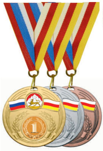
▲ МК204 d - 55 мм