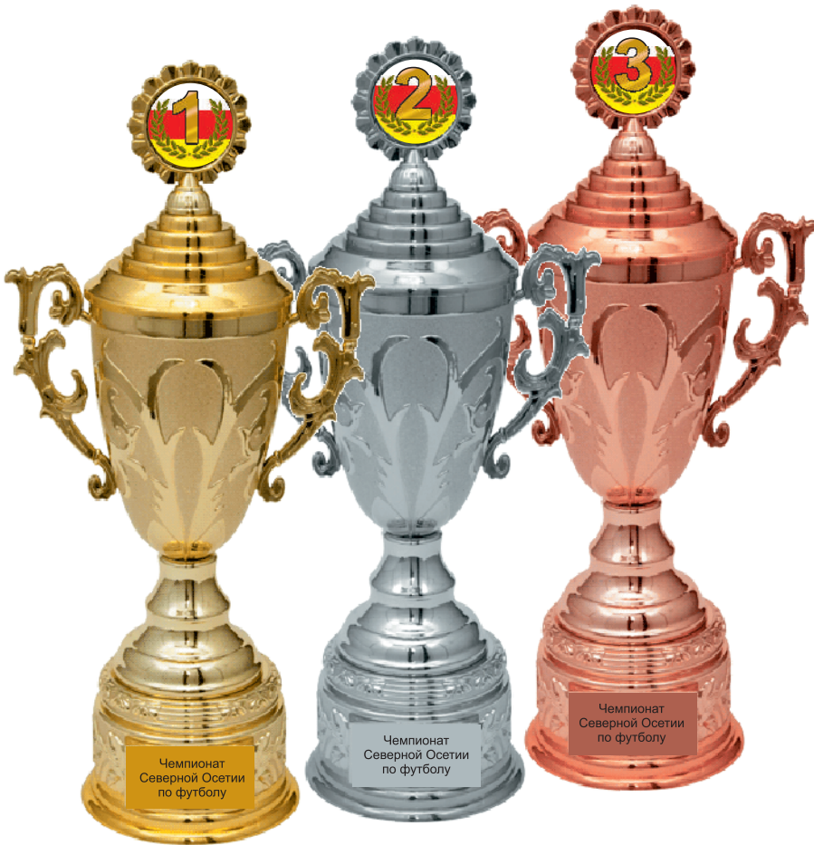
Чемпионат Северной Осетии по футболу