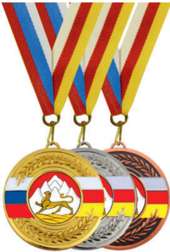
▲ МК97 d - 50 мм