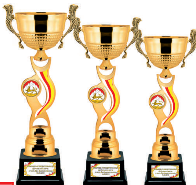
▶ KM 1651a 51,5 см KM 1651b 49 см KM 1651c 45 см