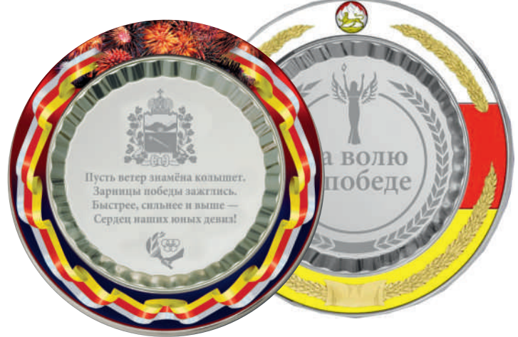
▼ Декоративная тарелка, d - 28,5 см