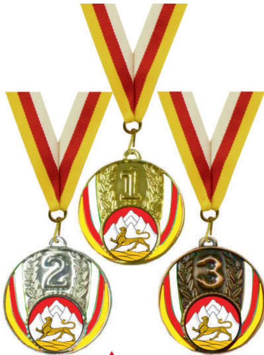
▲ МК230 d - 50 мм