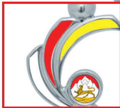
KM 1394a 51,5 см KM 1394b 47 см KM 1394c 42 см