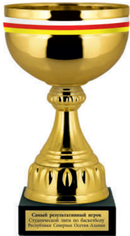
▲ KM 839a 27 см KM 839b 24 см KM 839c 21 см KM 839d 19 см