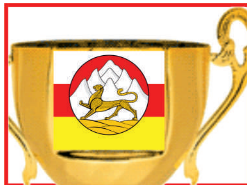
Турнир по шахматам