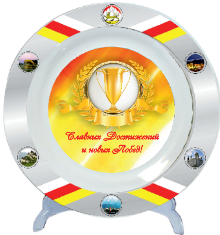
▼ Керамическая тарелка