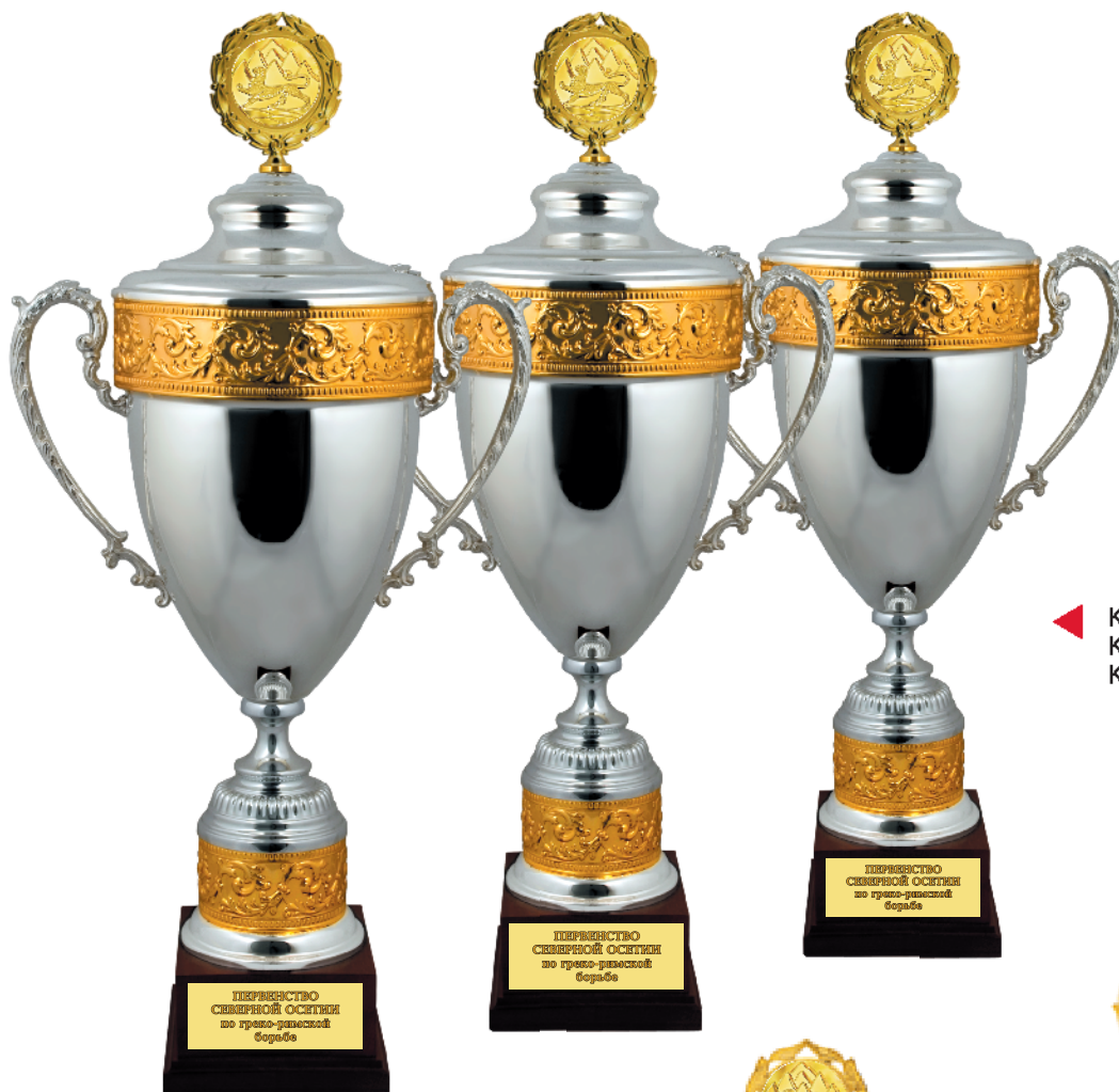
▶ KM 367a 83 см KM 367b 78 см KM 367c 74 см