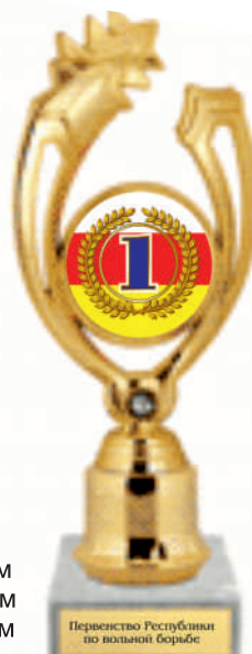
▶ Ps1063a - 22 см Ps1063b - 20 см Ps1063c - 19 см