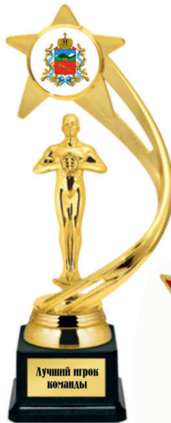
▲ Ps1100a - 31,5 см Ps1100b - 29,5 см Ps1100c - 27,5 см