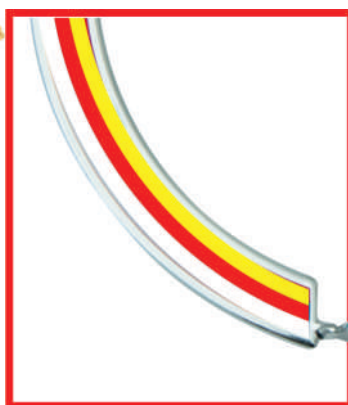
◀ KM 1609a 49,5 см KM 1609b 45,5 см KM 1609c 40 см