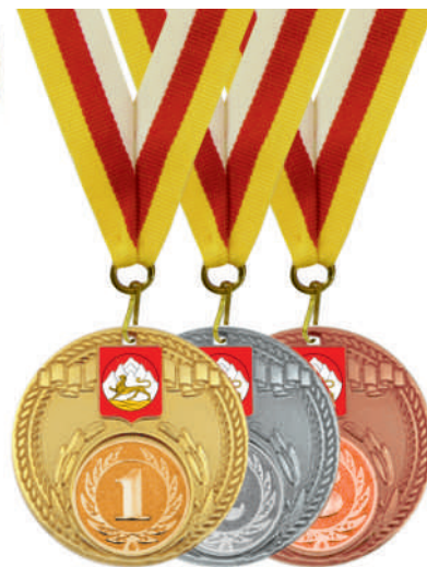
▲ МК99 d - 55 мм