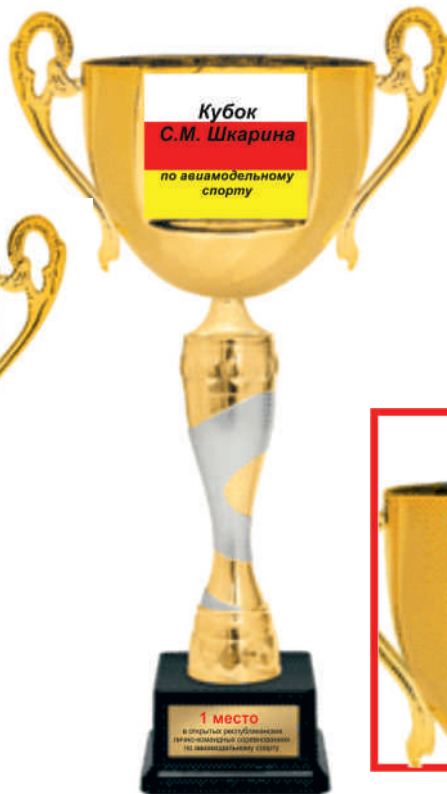
▲ KM 1623a 51,5 см KM 1623b 46,5 см KM 1623c 41,5 см