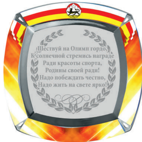
▼ Декоративная тарелка, 25x25 см