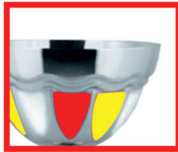
KM 1286a 29 см KM 1286b 26 см KM 1286c 22 см