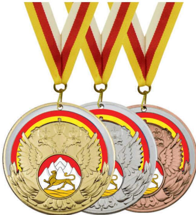
▲ МК168 d - 70 мм