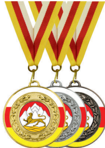
▲ МК162 d - 50 мм