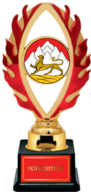
▲ Ps1033a - 23 см Ps1033b - 20,5 см