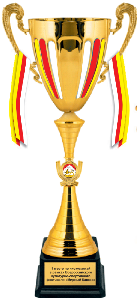
KM 1323a 56 см KM 1323b 48 см KM 1323c 45,5 см