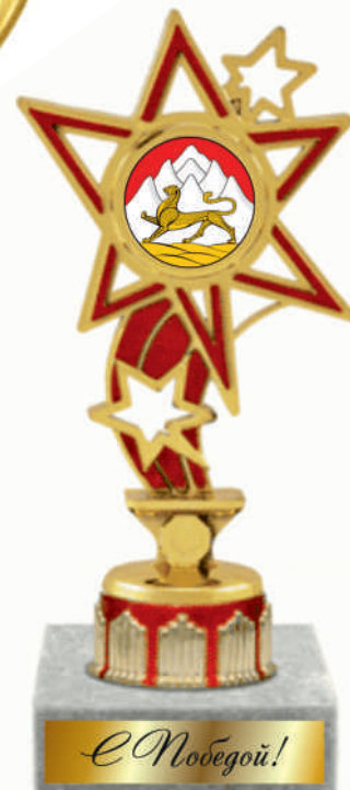
▼ Ps1036a - 22,5 см Ps1036b - 20,5 см Ps1036c - 17,5 см