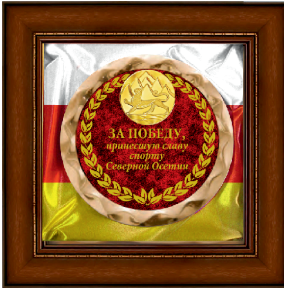
▼ Настенное панно, 34x34 см