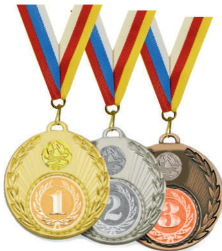
▲ МК111 d - 50 мм